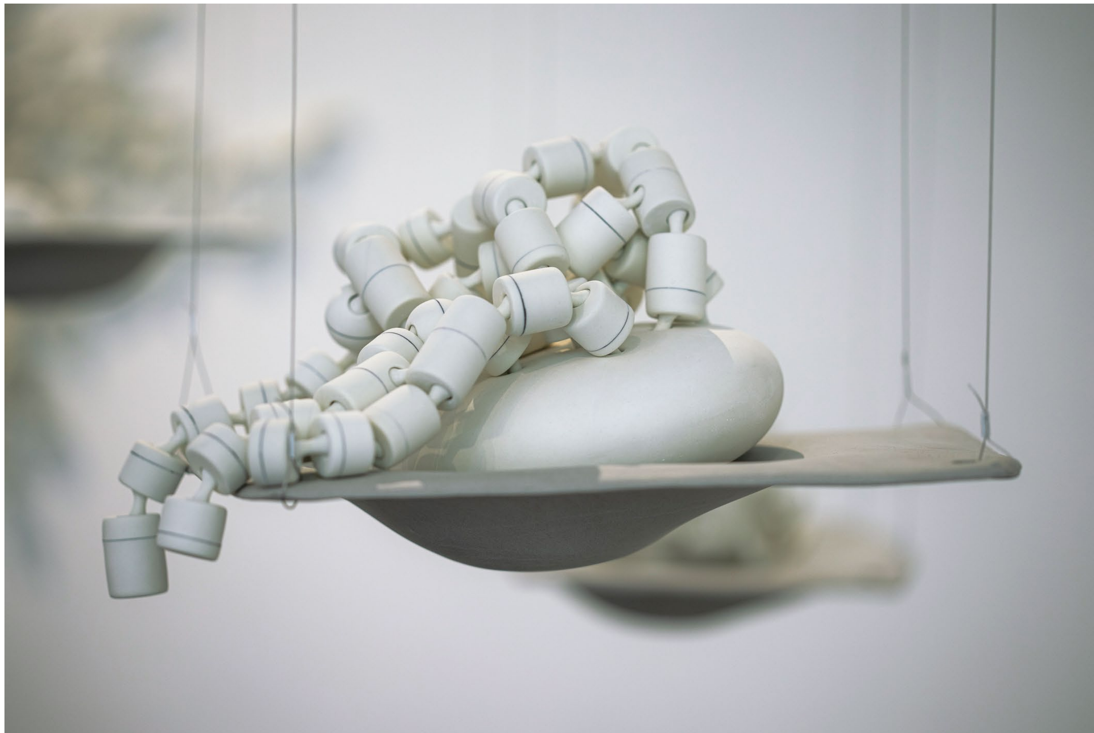
דומז, 2023. פורצלן, יציקה לתבנית, 14×14.5×14.5 ס"מ, צילום: לירז סיאני לופז