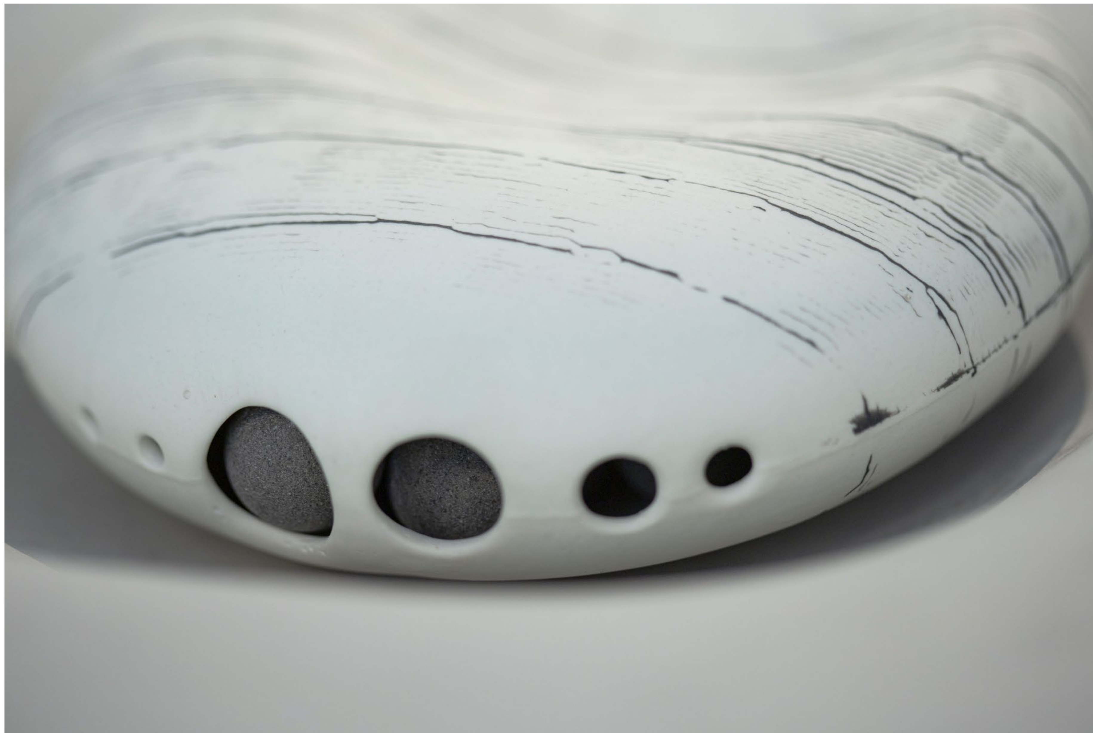
לוֹדָה, 2022, פורצלן ואבנית, יציקה לתבנית ואינליי (inlay), לחיצה לתבנית, 5.5×14.5×14.5 ס"מ