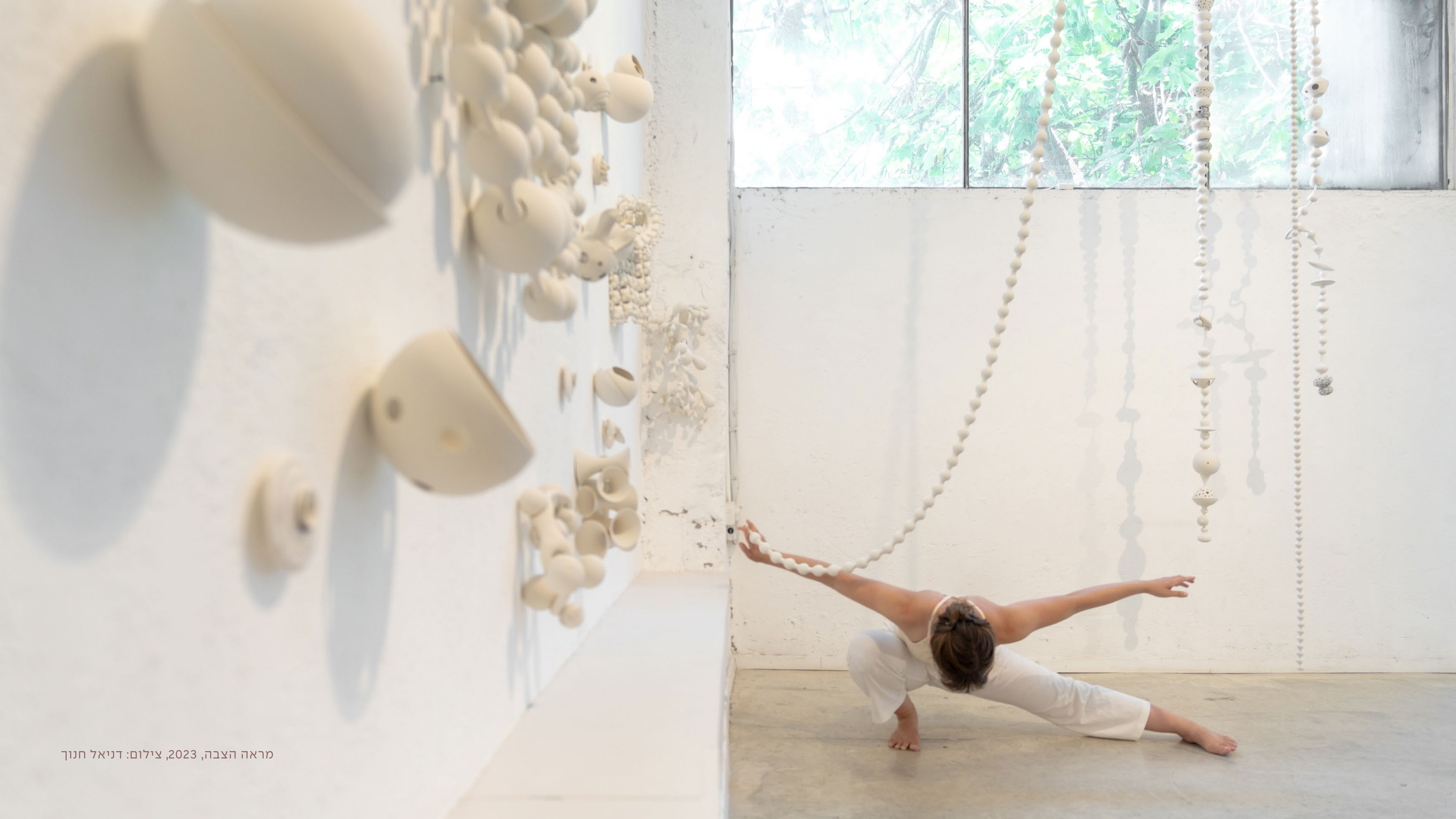
מראה הצבה, 2023