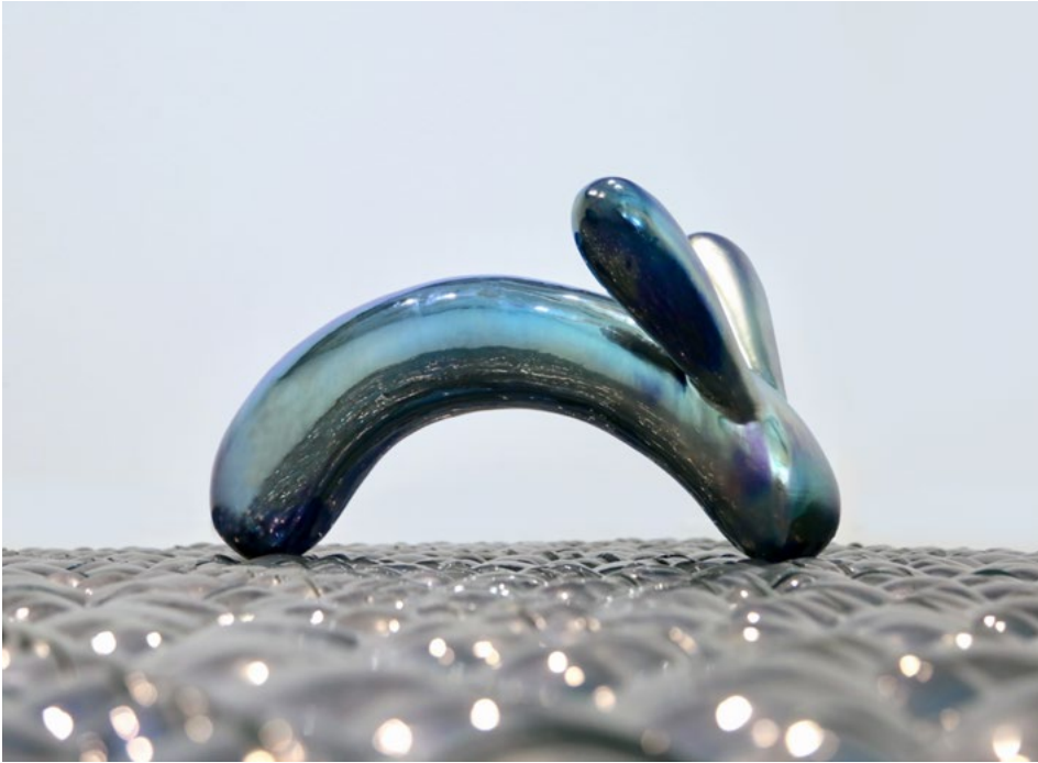
Bunny, פרט מתוך Pari-daiza (פארי־דאיזה, גן תחום), 2021, 86 × 51 × 48