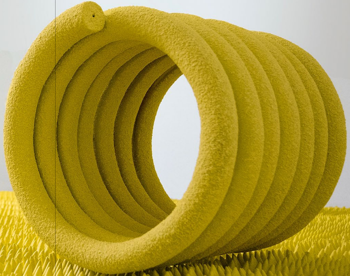
Coils, פרט מתוך Oasis (נווה מדבר), 2021, 53 × 56 × 56