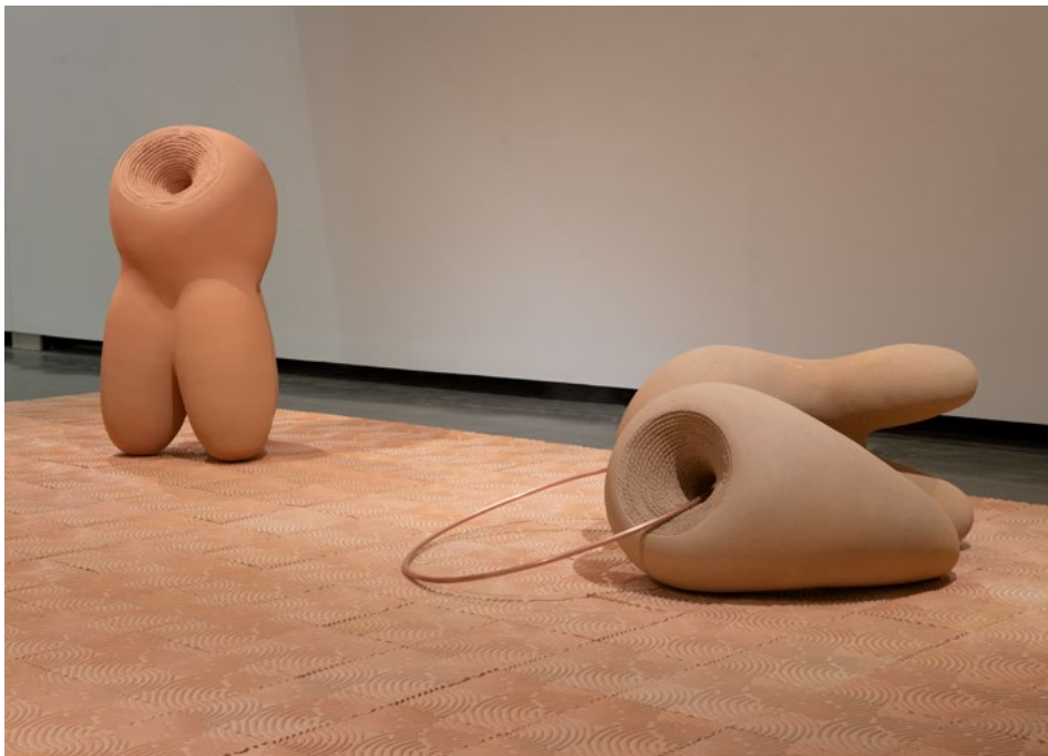
The Fertile Crescent (הסהר הפורה), 2021, ימין 81 × 81 × 140, שמאל 71 × 107 × 122, צילום: Brian Oglesbee

גבי החבל, אני מפרק את השלד הפנימי ושולף את החבל. בניאלה האחרונה בתל אביב הצגתי גופים שנעשו בטכניקה הזאת, ואוצרי התערוכה היטיבו לתאר את תהליך העבודה באופן פואטי: "תהליך המתחיל בבנייה בשלד עץ המלוכף בחבל ומסתיים בריקון הקרביים וניתוק חבל הטבור, מאזכר לידה אנושית". במהלך השנים, תוך כדי מחקר ושימור של טכניקה עתיקה זו, הפכתי אותה מטכניקה לבניית כדים לטכניקה עיקרית לפיסול, והיא הפכה לכלי נוסף בארגו הכלים שלי, לצד שימוש חדשני במודלים ממוחשבים.