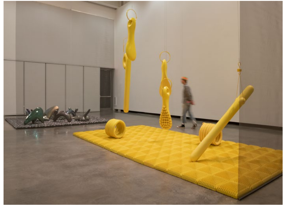
Dar - terra incognita (דאר - טרה אינקוגניטה), 2021